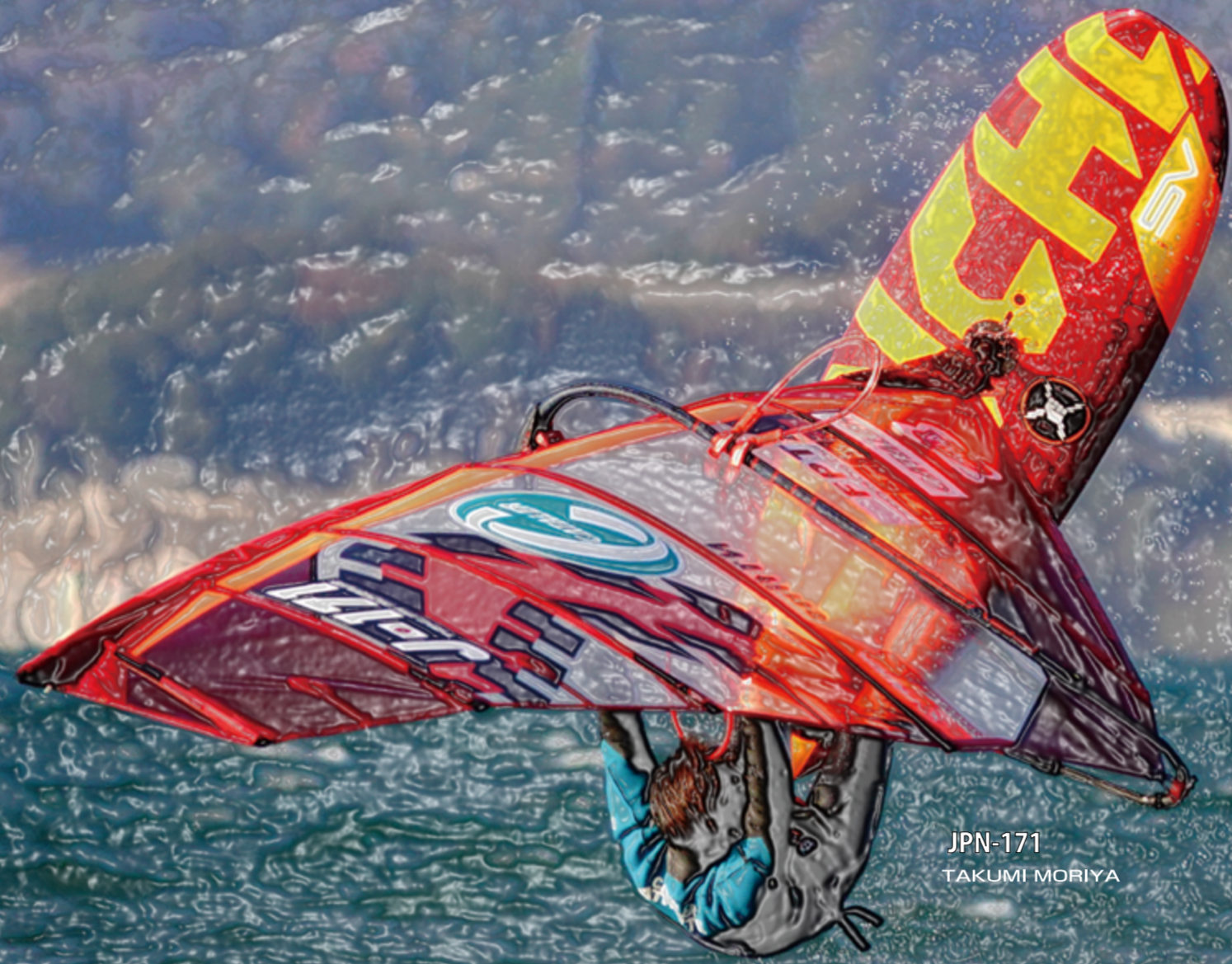
JPN-171 TAKUMI MORIYA