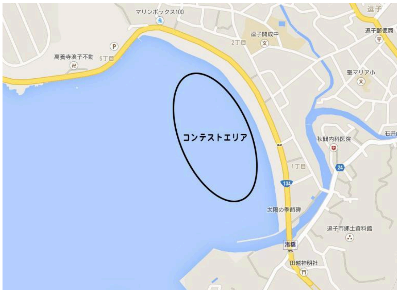
図1: コンテストエリア