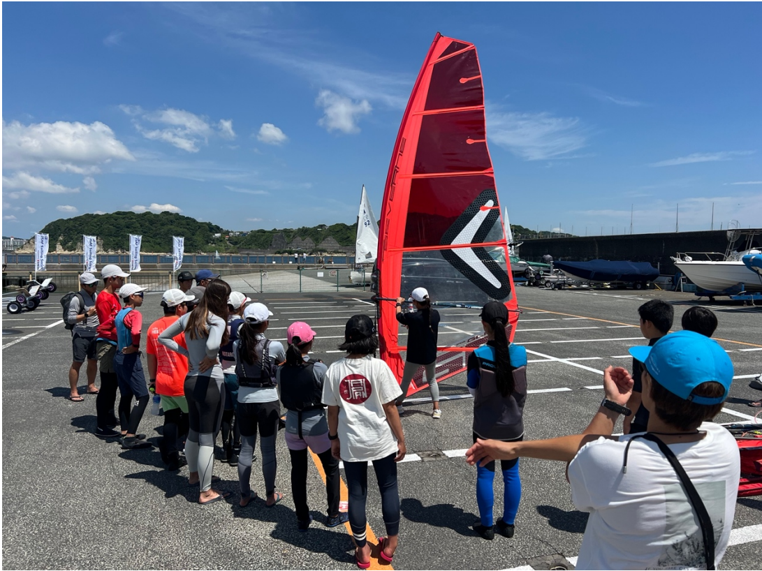
【第2回境港ラウンド】