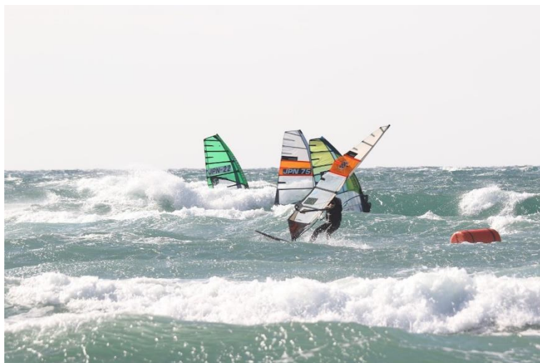
インサイドマーク回航風景