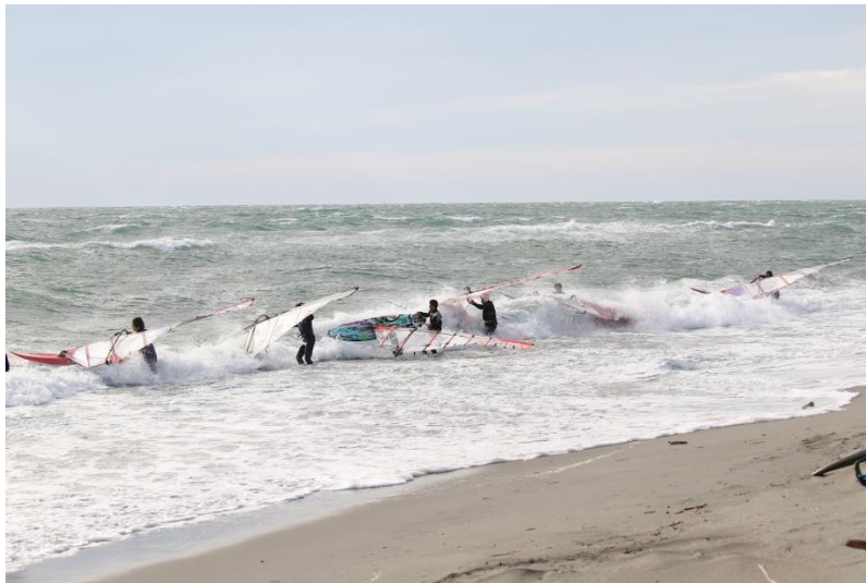
ビーチスタート方式によるスタート風景

プロウィメンズクラスには、6名のエントリーがあり、一発勝負でのヒート進行となりました。