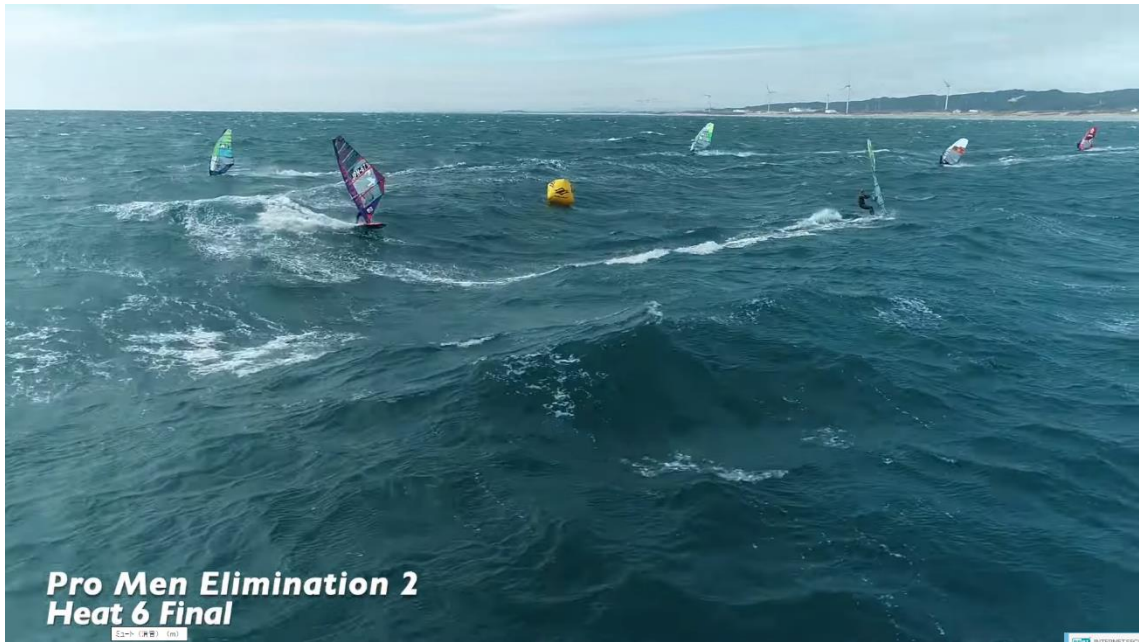
ドローン撮影による、アウトマーク風景