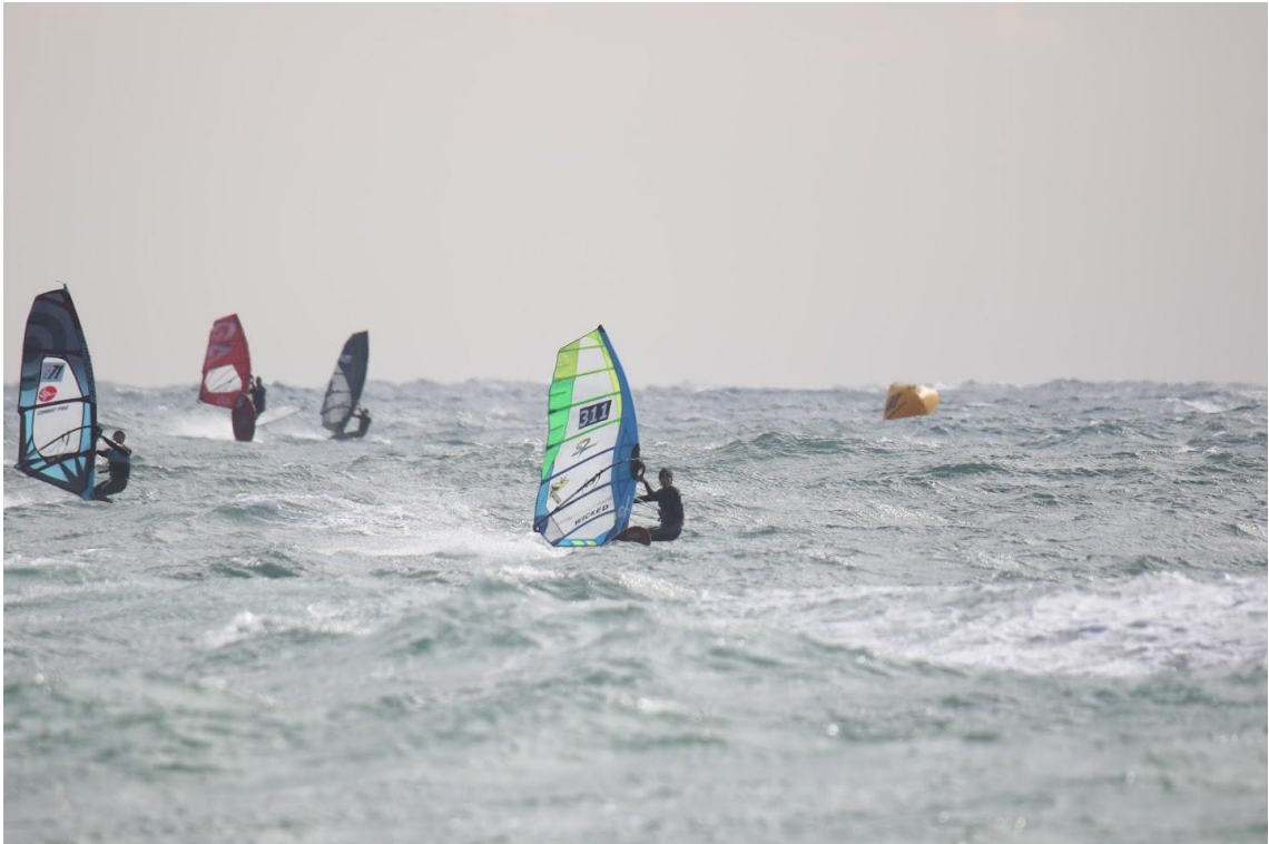
Elimination 1.2 1位 JPN-311 穴山プロ