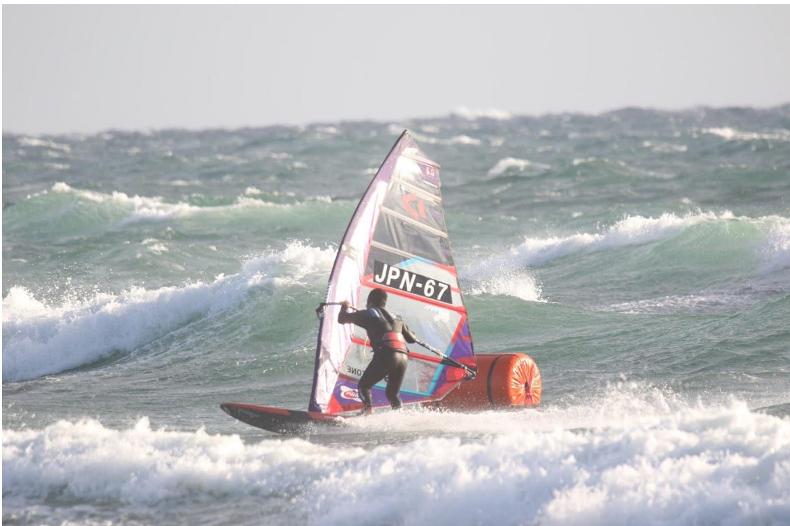
Elimination 1 プロメNZ 2位 JPN-67 山田プロ