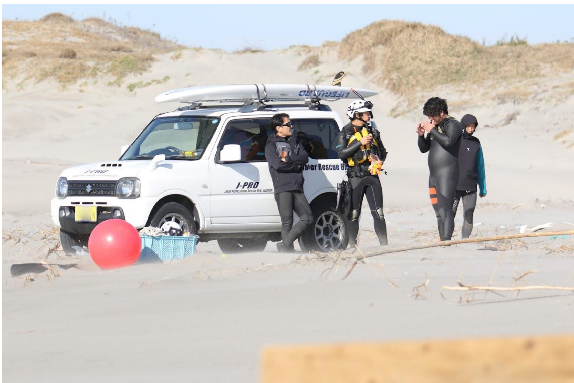
この大会は JPRO 様無しでは、成立しません。