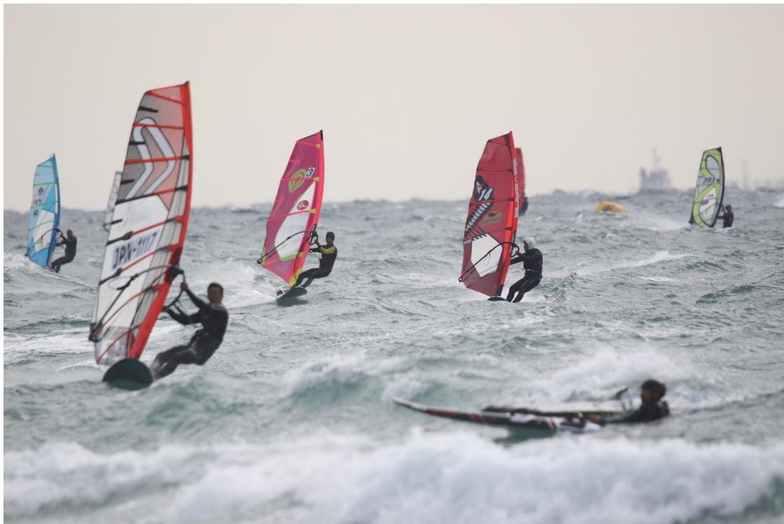
オープンメンズレース風景

プロクラスの Elimination 1.2 終了後、メンズオープンクラスのヒート進行となり、エントリー数は10名、コース1周による一発勝負にてヒート進行となりました。 プロクラスとのWエントリーの選手も多く、体力勝負でもありました。