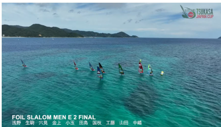
第2レースメンズfinalファーストマーク回航風景