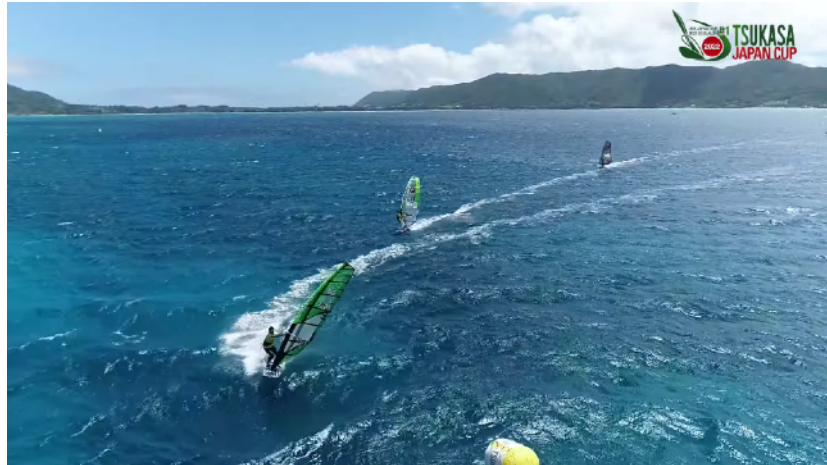
2位 1位 1位と初日暫定 1位 JPN-22 須長選手