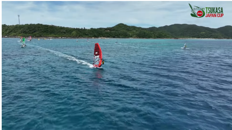
メンズオープンJPN-97田淵選手 1位2位2位 2日目暫定2位