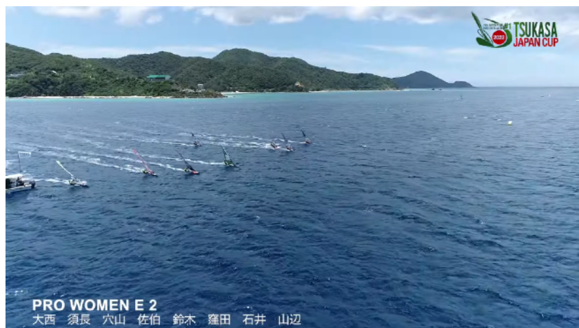
プロウィメンズ レース2 スタート風景