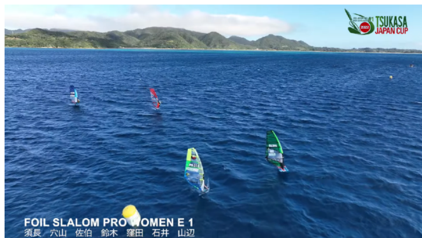
FOIL SLALOMウィメンズ1 レース穴山VS須長 トップフィニッシュJPN-311穴山プロ 大会初日は、プロクラス・メンズ、ウィメンズ共に3レース、FOIL SLALOMがメンズ、