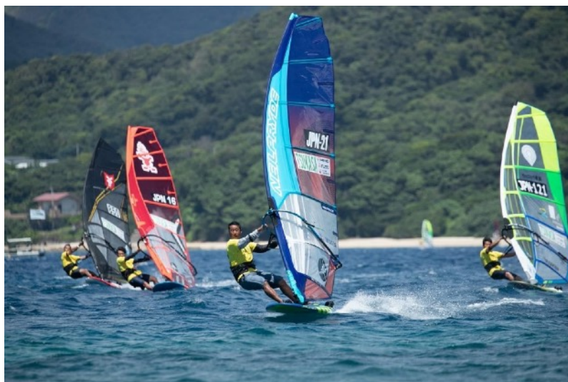
3レース安定した走りで、初日暫定2位JPN-21生駒プロ