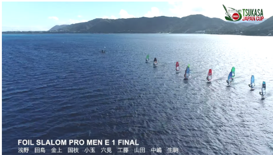
FOIL SLALOM メンズファイナル スタート風景