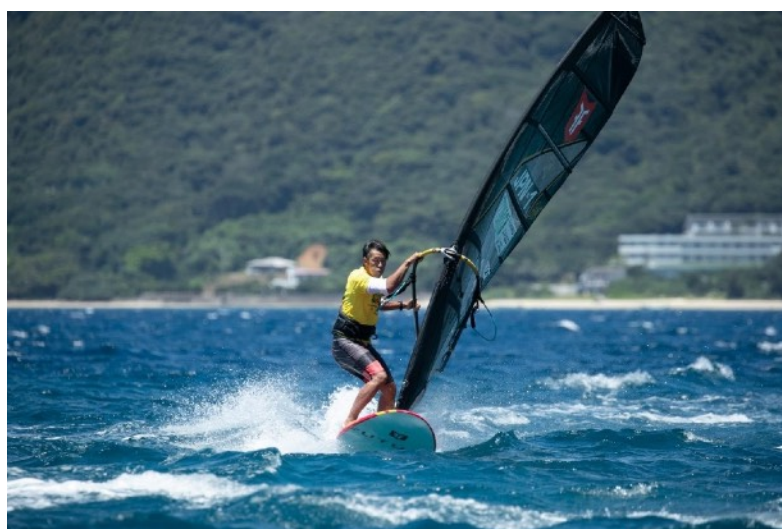
風上からスピードのあるファーストマークアプローチが印象的なJPN-1合志プロ