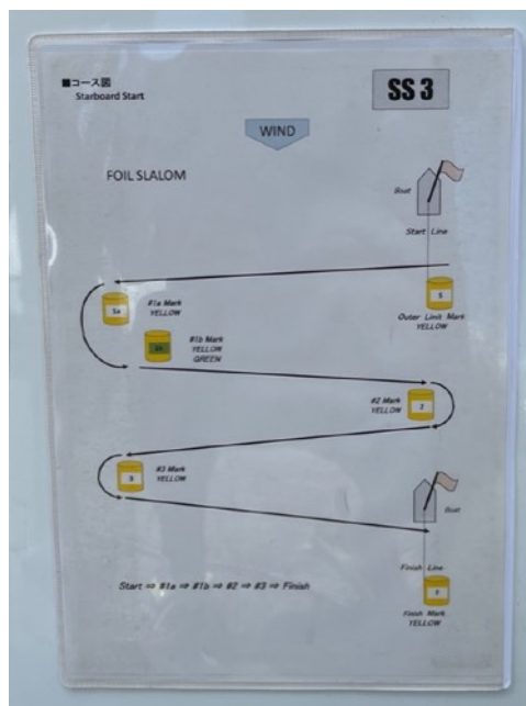
FOIL SLALOMコース図 ファーストマークにオフセットマークが設置されます。

FOIL SLALOMメンズクラスには、18名のエントリーがあり、上位5名勝ち上がりによる1/2ヒート。ウィメンズクラスには、7名のエントリーがあり、一発勝負によるレースとなりました。