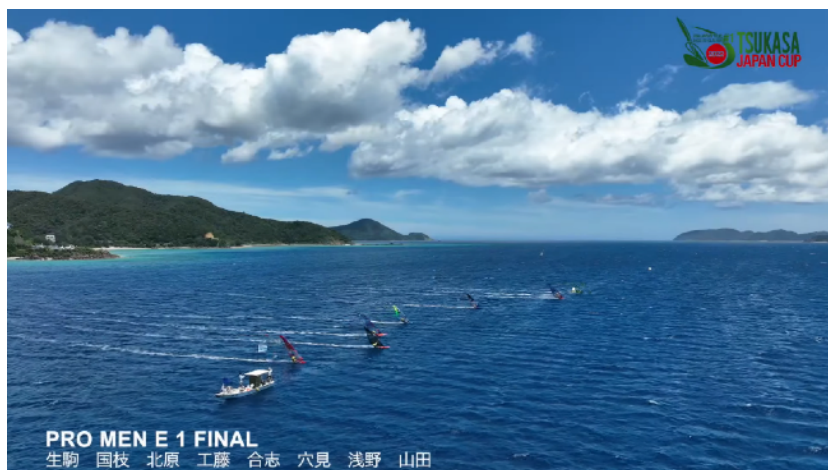
プロメンズ第1レースFinalスタート風景